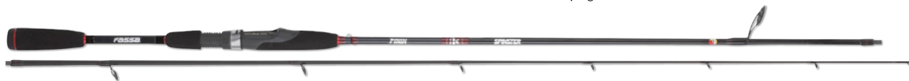
SPINSTER PININ - SPNSTPN700