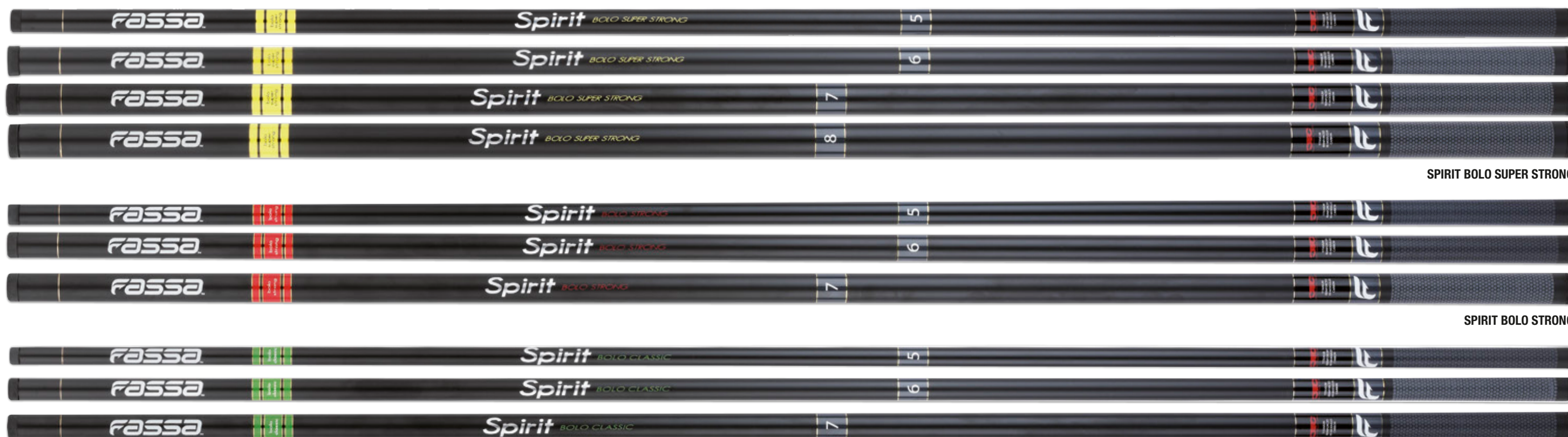
SPIRIT BOLO SUPER STRONG