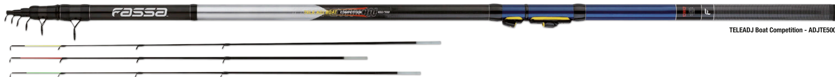
TELEADJ Boat Competition - ADJTE500