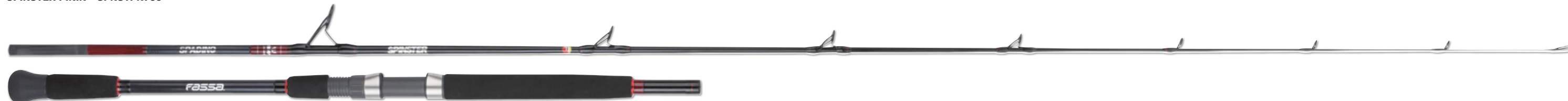
SPINSTER SPADINO - SPNSTSN740